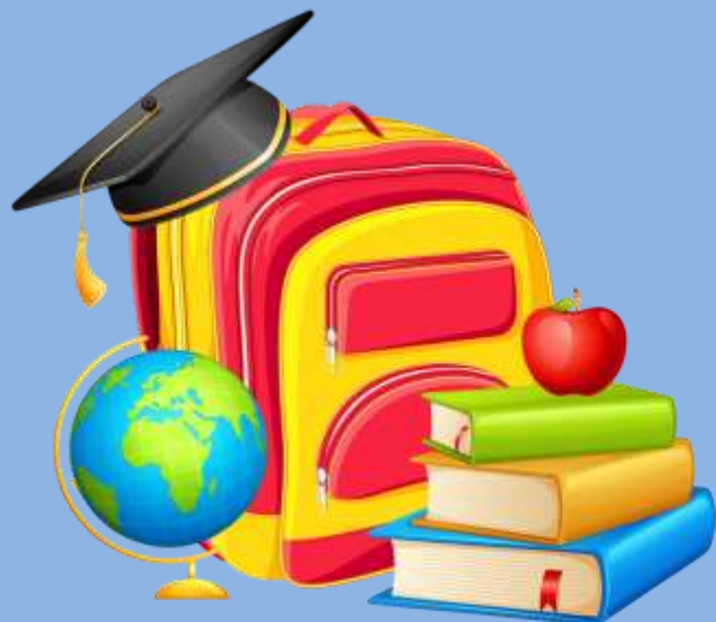
График проведения школьного этапа

1. Провести в 2024-2025 учебном году в общеобразовательных учреждениях Тихвинского района школьный этап всероссийской олимпиады школьников в соответствии с Порядком.